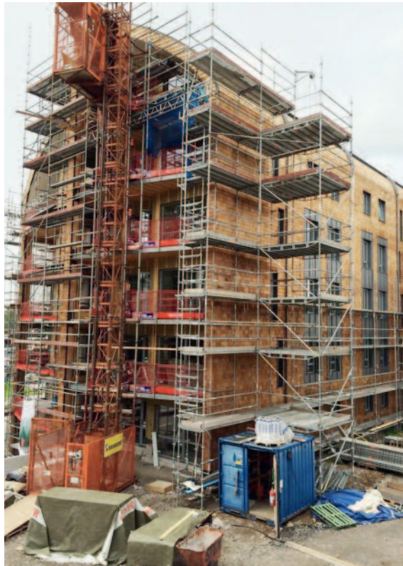
Figur 1: Nytt sexvånings massivträhus i Fristad uppfört av Silent Timber Build-partnern Fristad Bygg.

Genom de tidigare projekten AkuLite och AcuWood har forskningen inom akustik och trähus sedan 2009 fokuserat på vilka utvärderingsmått för ljudisolering som ska formuleras för att en byggnad i trä ska få en subjektiv värdering som svarar mot objektiva mät och utvärderingskriterier. Det vill säga om två byggnader med olika stommaterial subjektivt upplevs exakt lika avseende ljud från grannar så ska också det objektiva måttet vara exakt detsamma. Så är det inte än idag, men vi vet allt bättre hur det bör se ut. Men, även om mycket börjar ”klarna” så fördjupas denna forskning genom ännu ett projekt som just nu drivs på Luleå tekniska universitet, det är oerhört värdefullt. Till följd av resultat från pågående och nyligen avslutad forskning har forskarnätverket