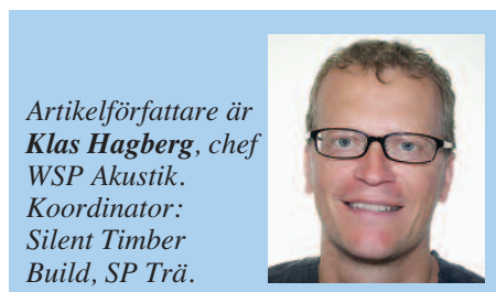
Artikelförfattare är Klas Hagberg , chef WSP Akustik. Koordinator: Silent Timber Build, SP Trä.

bland annat för att samla den bästa expertisen men också för att kunna täcka in ett så stort antal olika europeiska konstruktions typer som möjligt. Projektets partners, forskningsinstitutioner och industripartners, har ett tätt samarbete och de beräkningsmodeller som kommer att utvecklas anpassas till nya forskningsresultat avseende utvärderingskriterium. Syftet är också att kunna tillhandahålla nya viktiga resultat direkt till träbyggnadsindustrin men också till ISO- och CEN-standardiseringen så att dessa kan utvecklas ytterligare. Arbetsgången för Silent Timber Build beskrivs översiktligt i figur 2. Tanken är att använda en kombination av Finita elementberäkningar (FEM) och Statistisk energianalys (SEA) och resultaten kommer delvis att re-